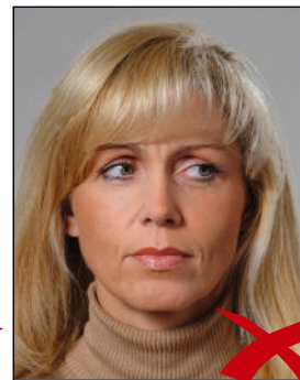
Blick zur Seite