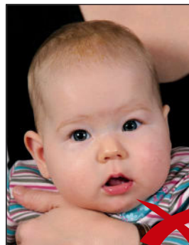
Zweite Person im Hintergrund