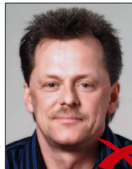
Reflexion im Gesicht