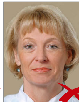
Hintergrund ohne Kontrast