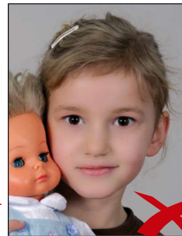
Gegenstand im Bild