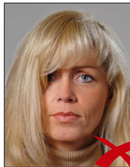
Haare im Gesicht