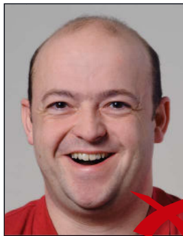
Mund zu weit offen

Die Person muss mit neutralem Gesichtsausdruck und geschlossenem Mund gerade in die Kamera blicken. ◀