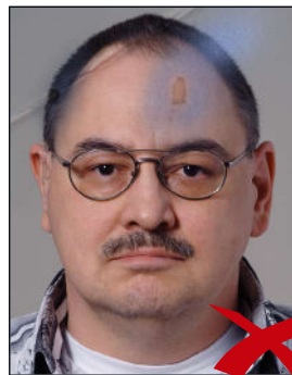
Knicke und Tintenflecke im Bild