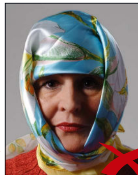
Schatten im Gesicht