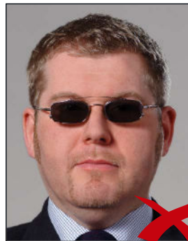
Brillengläser zu dunkel