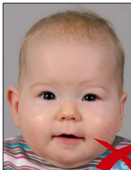
Kopf zu groß