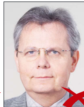
Kontrastarm durch Überbelichtung