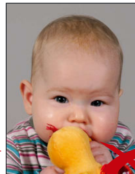
Gegenstand im Bild