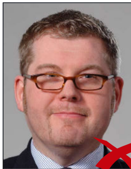
Brillenrahmen verdeckt Augen

Der Rand der Gläser oder das Gestell dürfen nicht die Augen verdecken. ◀