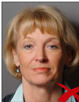
Schatten im Hintergrund

Auf dem Hintergrund dürfen keine Schatten entstehen. ◀